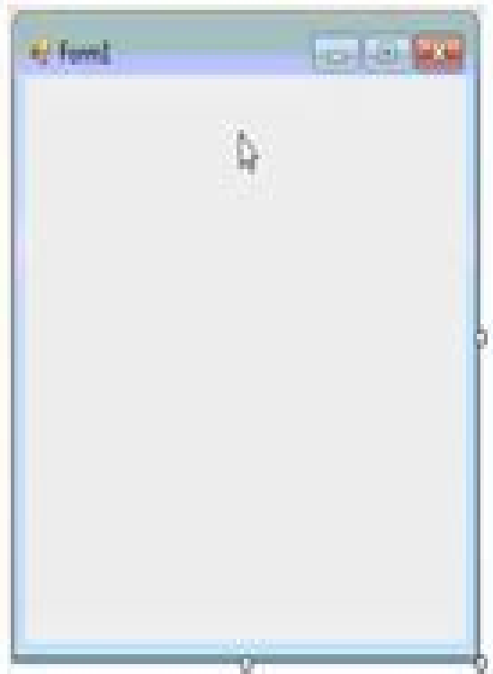
Form1.vb [Design] x