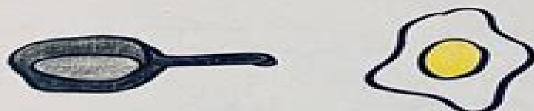
FRYING AN EGG