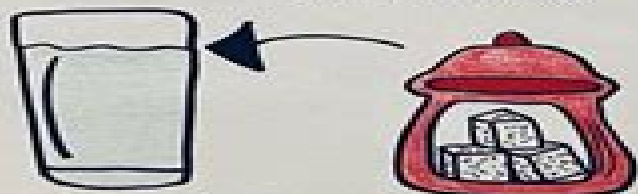
DISSOLVE "SUGAR" IN WATER