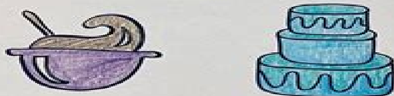
BAKING A CAKE